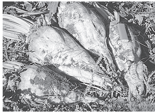
Гибрид УРАЗИ компании «Флоримон ДЕПРЕ»

— С «Флоримон Дебре» мы работаем не первый