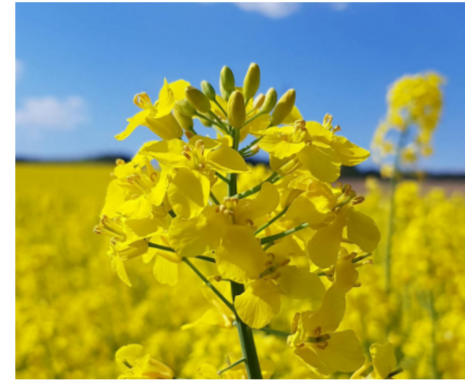
Новый сорт Таврион характеризуется высокой урожайностью, скороспелостью, толерантностью к стрессам и устойчивостью к болезням. Сорт показывает стабильные результаты в различных почвенно-климатических условиях