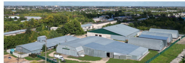
Семенной завод ООО «СибАгроЦентр» — это более 10 000 кв. м производственных и складских площадей. Семена отправляются в более 500 хозяйств из 38 регионов России и Казахстана.