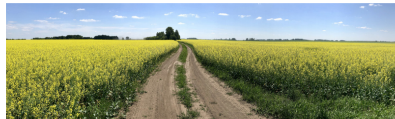
Если создать сортам и гибридам равные условия, отличия в урожайности будут незначительны. А при неблагоприятных условиях отечественные сорта покажут даже лучший результат!