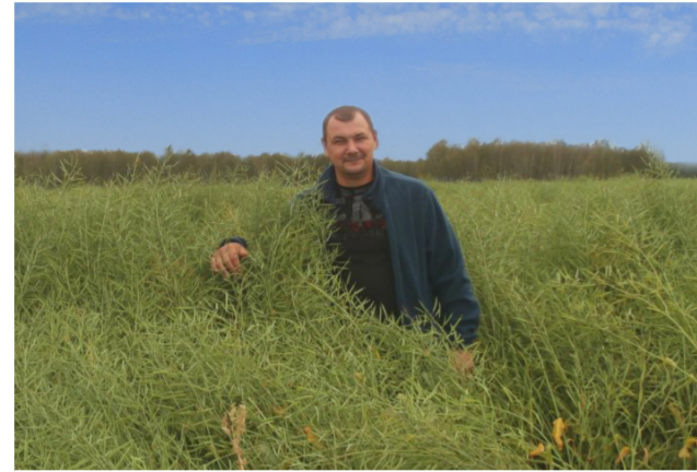
Компания «СибАгроЦентр» предлагает аграриям семена сортов ярового рапса, которые отлично зарекомендовали себя: Юбилейный, Таврион, высокоолеиновый Амулет. Также в ассортименте сорта 55 регион и Гранит

В Алтайском крае рапсовый клин уже достиг 65 тысяч гектаров. В Новосибирской области, по оценке Минсельхоза, увеличили посевные площади рапса до 90 тысяч га. В Красноярском крае в этом году площади под техническими культурами вырастут на 20% в срав-